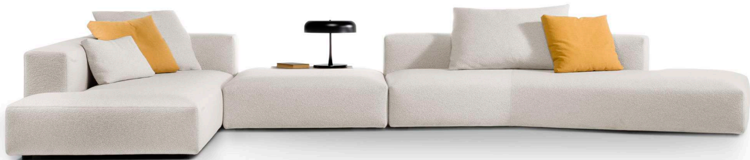
Troy / 1 terminal chaise 219, 1 pouf 106x106, 1 módulo chaise trapecio 260x160, cojines auxiliares.