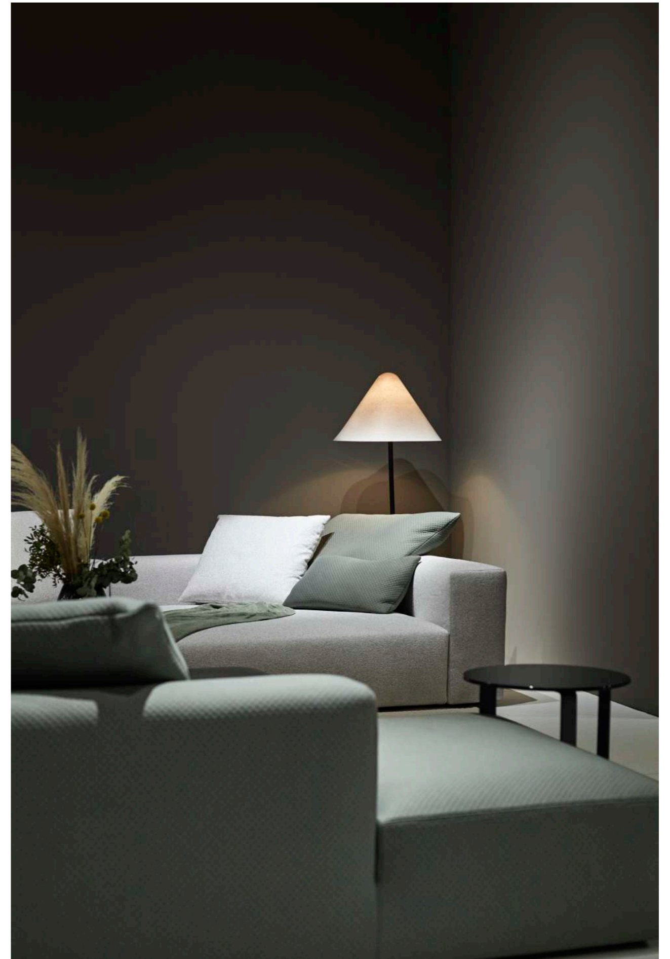
Troy / 1 chaise 157 1 brazo , 3 modulo 106 sin brazos , 1 sofa 237 1 brazo , 4 cojines respaldo 75 con rulo , cojines auxiliares.

The Troy model has completely removable covers.