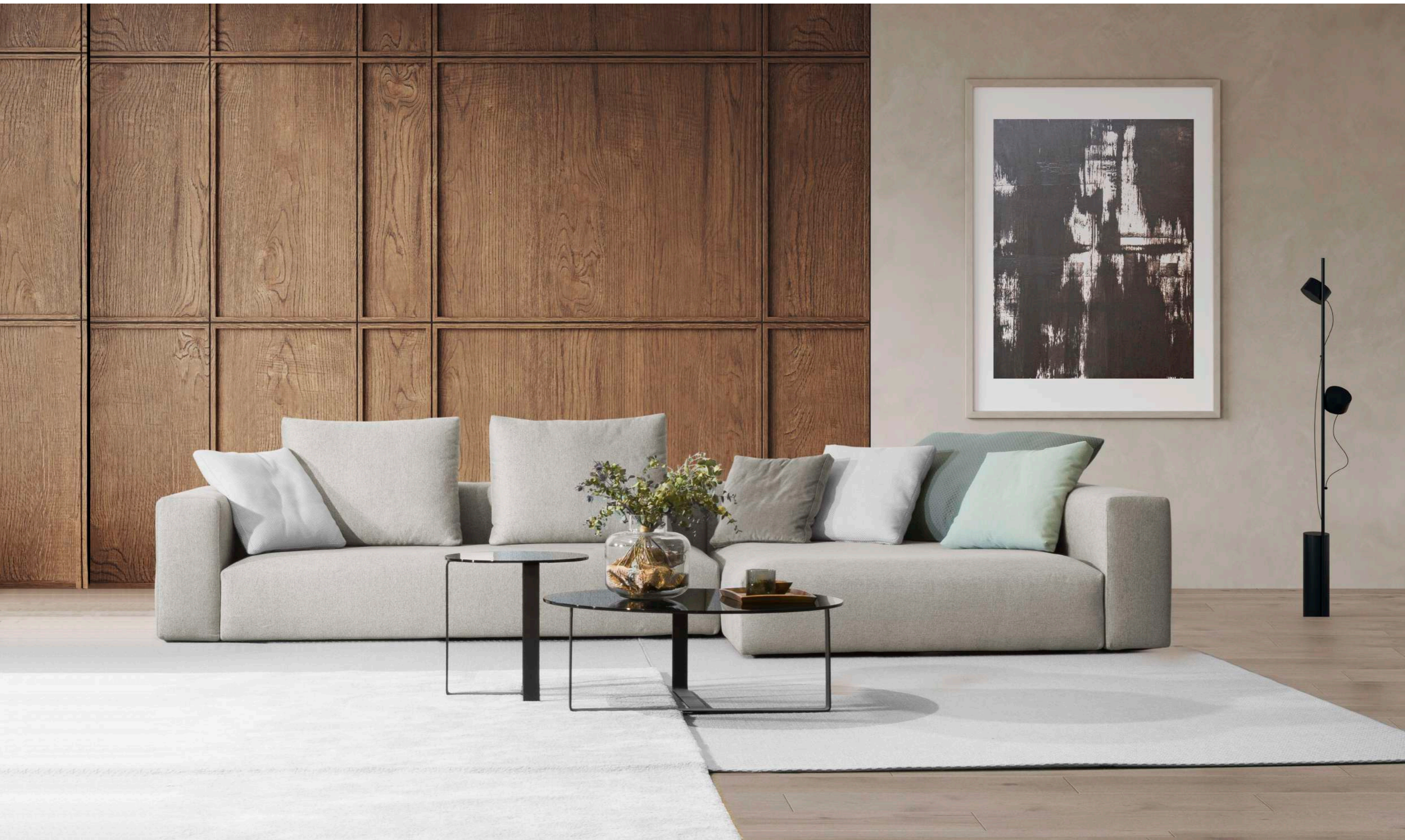
Troy / 1 sofa 237 1 brazo , 1 chaise 157 1 brazo , 2 cojines respaldo 75 con rulo , cojines auxiliares